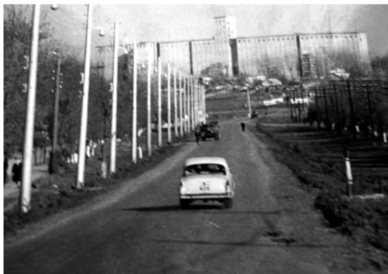
Улица Ленина в станице Новопокровской, 1967 год.

прокладывали водопроводы, электросети, строили электростанции, вели радиофикацию. Возводили жилые дома, клубы, школы, детские сады, бани, магазины. В поселке Кубанском и в станице Новоивановской завершалось строительство участковых больниц, а в хуторе Новый Мир — фельдшерского пункта. Только в совхозе «Кубанский» с 1957 по 1967 год ввели в эксплуатацию семь школ на 1680 учащихся, восемь детских садов на 425 мест, восемь магазинов, пять столовых, семь бань, больницу на 35 коек, 34680 квадратных метров жилья. На все это требовалось немало средств. И их руководители района, преодолевая многие препятствия, изыскивали всеми законными способами.